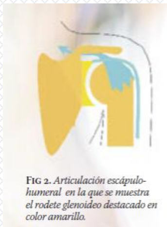
FIG 2. Articulación escápulo-humeral en la que se muestra el rodete glenoideo destacado en color amarillo.

El hombro no solo es una articulación, es la suma de varias (FIGURA 1). La más importante es la escápulo-humeral (A), pero, además de esta, hay otras como la acromio-clavicular (B), la escápulo-torácica (C) y la esternoclavicular (D).